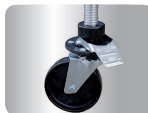
Pojízdná kolečka o průměru 200 mm mají dvojitý systém brzdění. I při plné zátěži se snadno odbrzdí a mohou být výškově nastavitelná v rozsahu 25 cm.