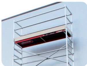
Dřevěné podlahy je velmi snadné převážet.