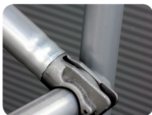
Spojení úchytu se vzpěrou je prolisem